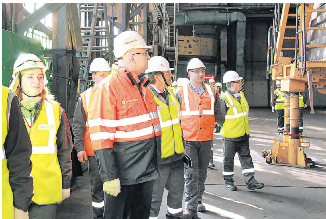
▲ Участники сессии смогли проверить полученные знания и отработать механизм применения ЛПАБ на практике в цехе ремонта технологического транспорта и горных дорожных машин

Наша миссия — постоянно менять ситуацию к лучшему, прививать сотрудникам культуру безопасного труда.