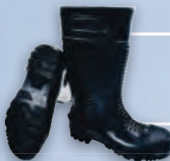
Сапоги шахтёрские резиновые