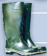
Сапоги полвинилхлоридные (ПВХ)