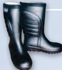
Сапоги полиуретановые (ПУ)