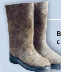
Валенки с резиновым низом