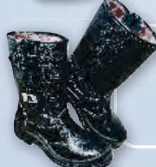
Сапоги кожаные утепленные на двуслойной подошве из полиуретана и нитрильной резины (ПУ/нитрил)