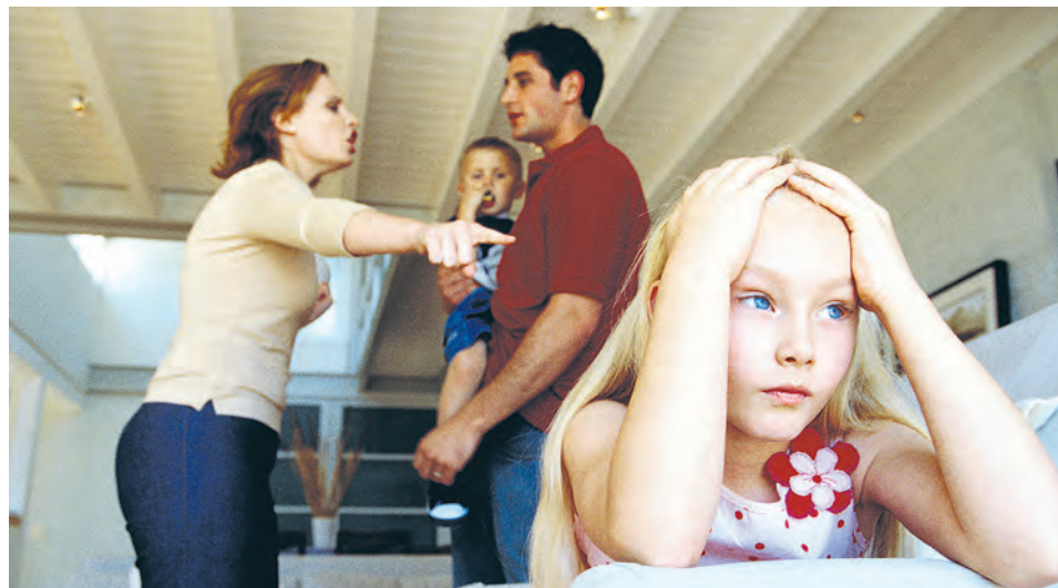
▲ Детям и приёмным родителям из семей «группы риска» окажут комплексную помощь

В этот раз специалисты ЦКРГ получили поддержку в размере двух миллионов рублей на реализацию проекта комплексного сопровождения семей из группы риска. Новый проект стал логичным продолжением проекта-победителя «Благополучная семья», который в 2018 году действовал в городе для опекунов семей. Теперь у него появился новый вектор: это педагогическое сопровождение опекунов семей, в которых взрослые не справляются со своими обязанностями, поскольку злоупотребляют алкоголем и наркотиками.