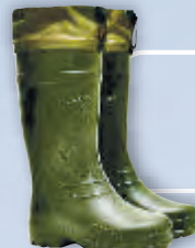
Сапоги этиленвинилацетатные (ЭВА)