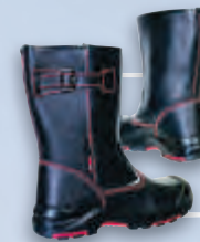
Сапоги кожаные на двуслойной подошве из полиуретана и нитрильной резины (ПУ/нитрил)