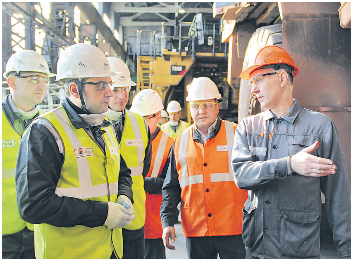
▲ У каждого из руководителей Металлоинвеста при посещении цеха и его участков была возможность в беседе с ремонтным персоналом потренироваться в проведении поведенческого аудита, обсудить последствия небезопасных действий и выбрать правильные способы работы