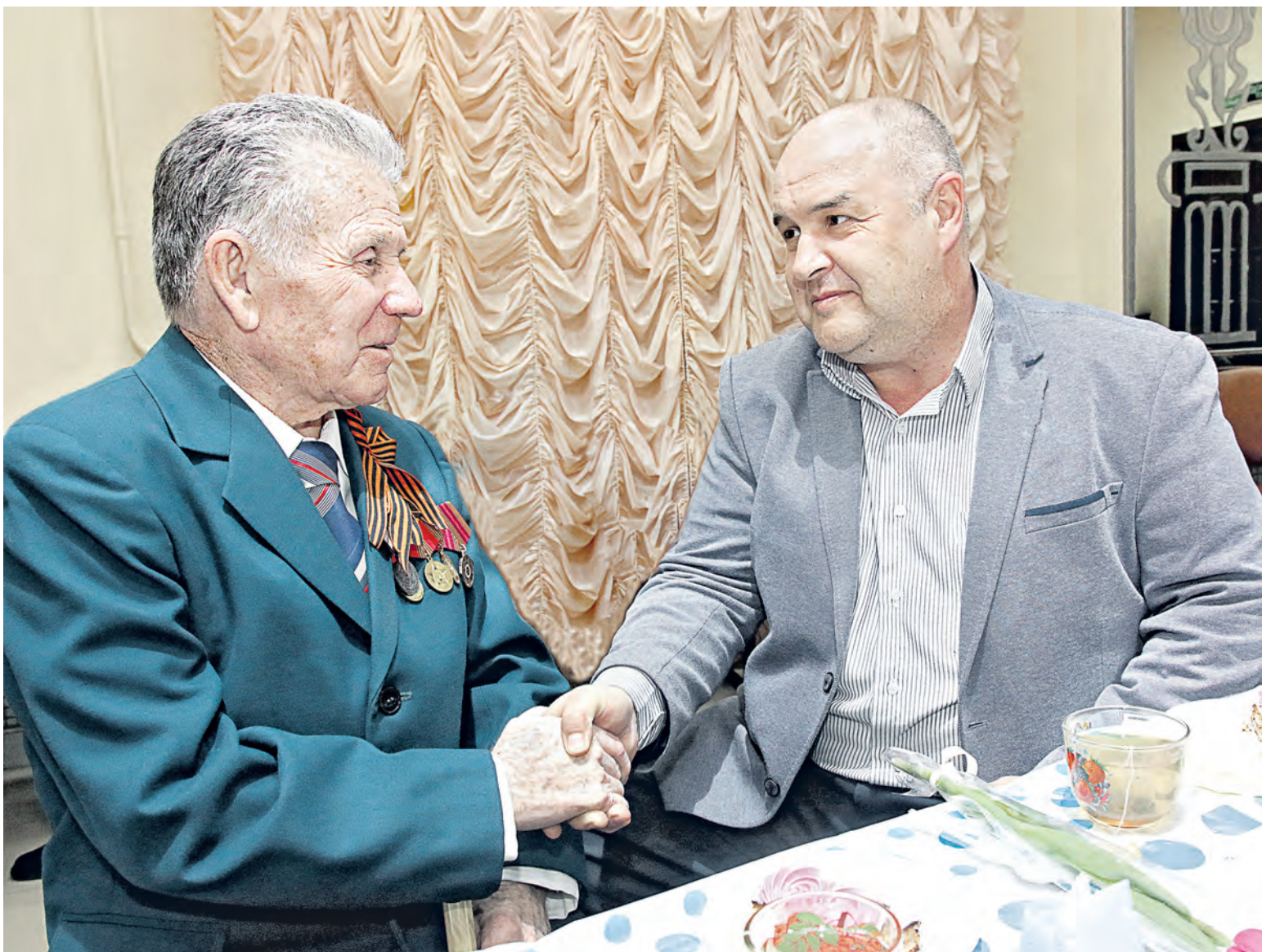
▲ Связь поколений нерушима, пока молодёжь помнит, что довелось пережить их дедам и прадедам, приближая День Победы