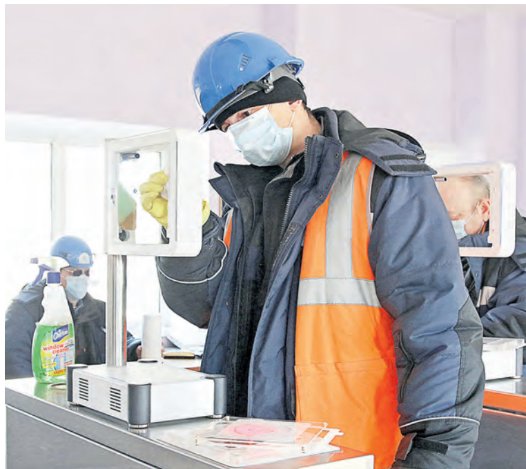
▲ Бесконтактная алкорамка не может стать источником заразы, но для большей безопасности их трижды за смену протирают дезинфицирующим раствором

На всех предприятияхMetalloinvestа в связи с возможностью распространения коронавируса вводятся повышенные меры безопасности.