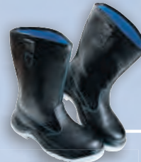
Сапоги кожаные на двуслойной подошве из полиуретана и термополиуретана (ПУ/ТПУ)