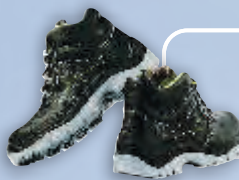
Ботинки кожаные на двуслойной подошве из полиуретана и термополиуретана (ПУ/ТПУ)