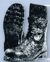
Сапоги литейщика кожаные на однослойной подошве из нитрильной резины