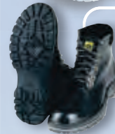
Ботинки кожаные на противоскользящей подошве из термоэластопласта (ТЭП)