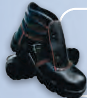
Ботинки сварщика кожаные на двуслойной подошве из полиуретана и нитрильной резины (ПУ/нитрил)