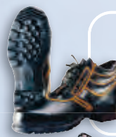
Ботинки от термического риска электродуги кожаные на однослойной подошве из нитрильной резины