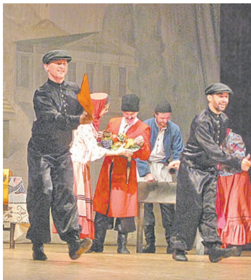
Танцы вносят яркую краску в колорит старого Тбилиси