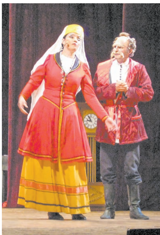
Есть у меня для тебя, князь, невеста...