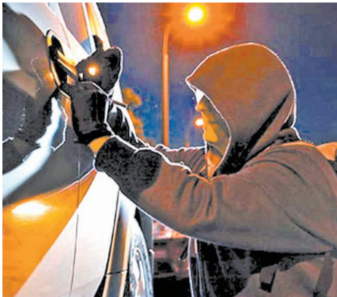
Сегодня автомобильные воры согласны красть машины не только целиком, но и по частям

чтобы злоумышленник не смог быстро завладеть вашей автомашиной: оборудуйте ее противоугонными комплексами, включающими в себя электронные и механические противоугонные устройства, GPS- и GSM-маяки;