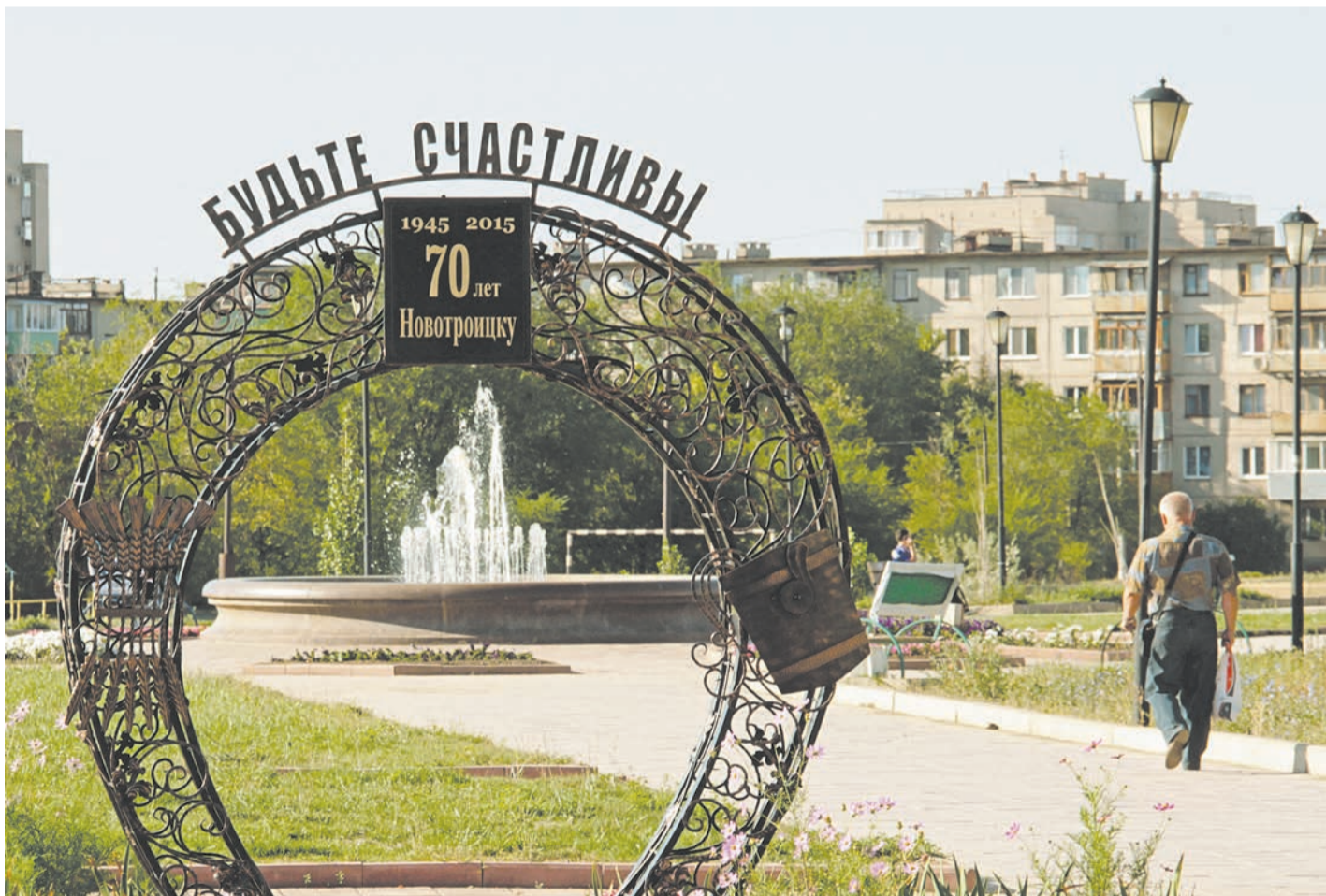
Архитектурный объект «Подкова счастья» – один из проектов «Перспективные»

Предприниматели, представители Metalloinvesta, городской администрации, промпредприятий, образовательных учреждений обсудили пути развития проекта «Перспективные».