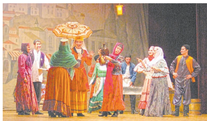
...Под горой течет Кура, за Курой шумит базар, за базаром — Авлабар

М узыкальная комедия — это всегда экспрессия, веселье, искромётные диалоги, умение актеров покорить зрителей искусным вокалом и хореографией, быть гармоничными и убедительными в раскрытии образов. В памяти всплывают те самые афоризмы: «Ваши трехдоймовые глазки...», «В Париже свой Авлабар есть...», которыми зрители набивают карманы, чтобы когда-нибудь процитировать при случае. Яркие образы, игра контрастов, интересные персонажи, чьи черты иногда сильно гиперболизированы — все работает на то, чтобы положительные эмоции надолго остались в наших сердцах.