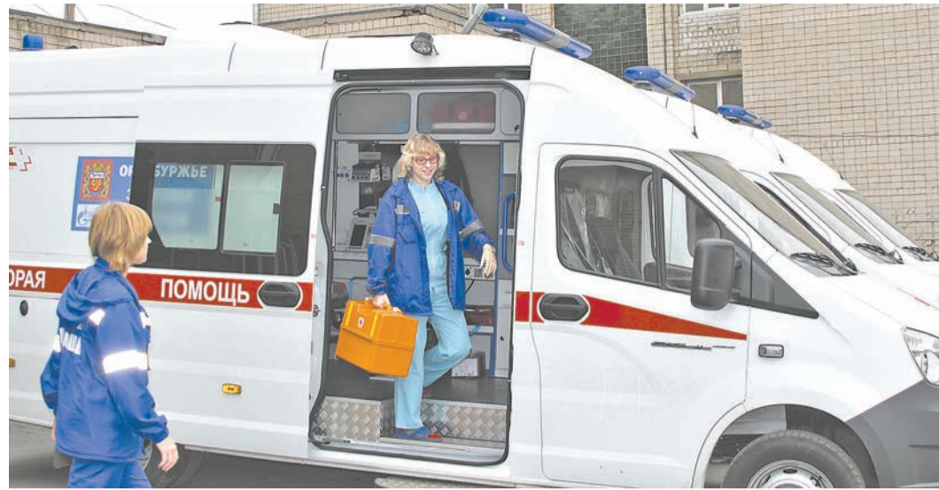
Современные и надежные машины «скорой помощи» — гарантия своевременного прибытия к пациенту