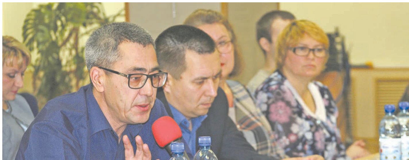
Промышленность, бизнес, образование, социальная сфера – все заинтересованы в развитии городской среды