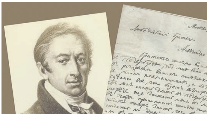
Оренбуржье – колыбель российской истории, здесь родился Карамзин

Юридически дети, рожденные и выросшие в Симбирской губернии, не могли доказывать родство между собой, обращаясь к помощи жителей Оренбургской губернии. Из