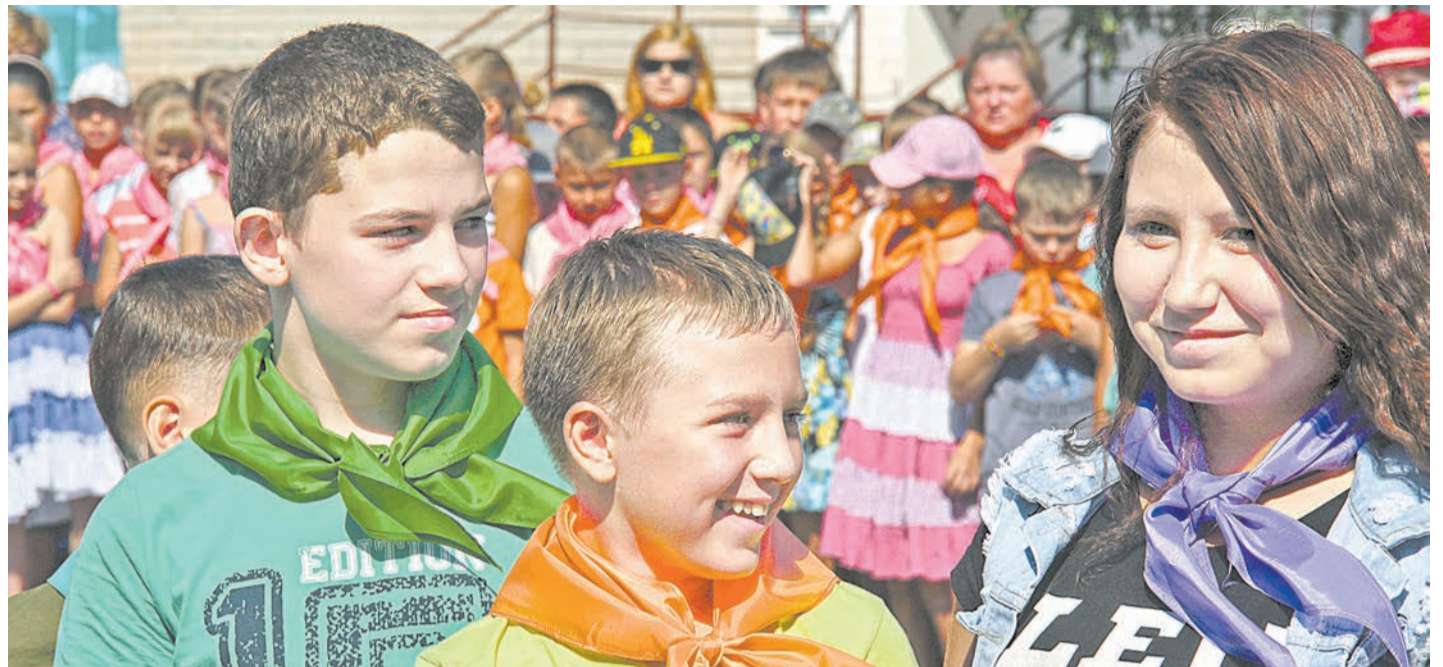
В этом году воспользовались господдержкой на отдых 1920 юных новотройчан