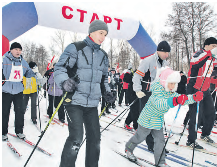
▲ А на Уральской Стали для развития лыжного спорта регулярно проводится акция «Уральский выходной»