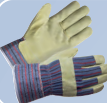
Перчатки спилковые комбинированные