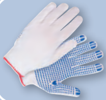
Перчатки хлопчатобумажные с точечным покрытием