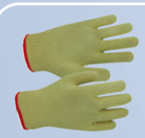
Перчатки арамидные термостойкие