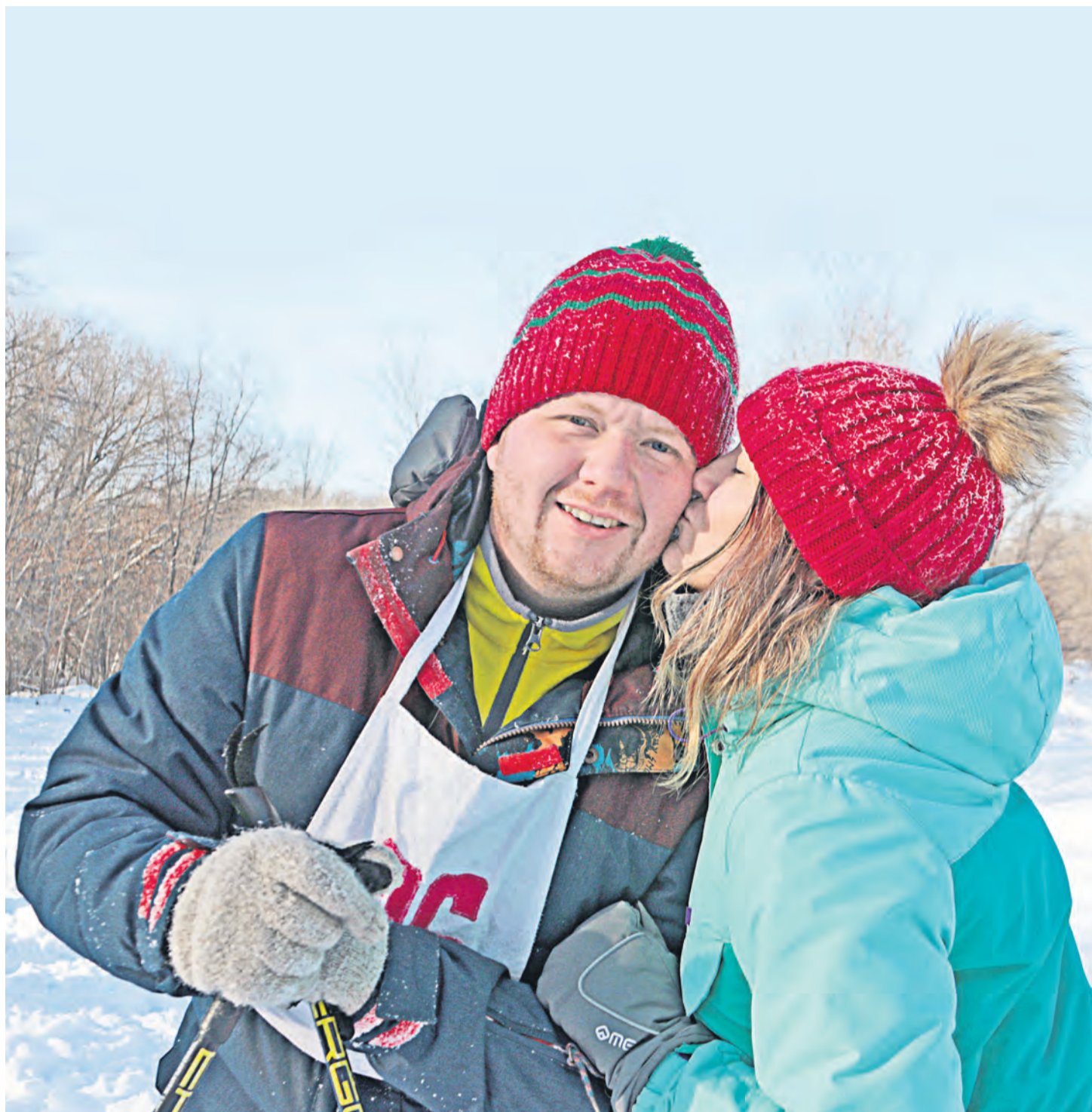
▲ Хорошая погода и хорошие люди вокруг — гарантия отличного самочувствия, которого с запасом хватит до следующих выходных