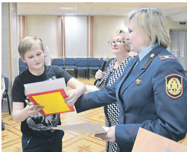
▲ Грамоты получили все участники конкурса

Призовые места в финале достались самым внимательным и сообразительным. Первое заняли воспитанники детского клуба имени Марии Корецкой