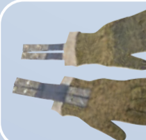
Перчатки с токопроводящей нитью

Для эффективного использования защитных свойств СИЗ рук, а также в целях безопасного выполнения работ необходимо: