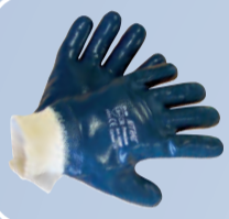
Перчатки с нитриловым покрытием