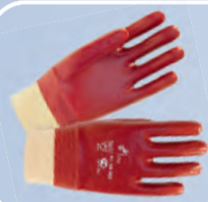
Перчатки с ПВХ-покрытием