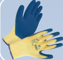
Перчатки полиэфирные с латексным покрытием